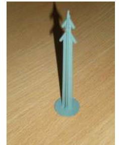
« Sapin »

La manipulation est très aisée du fait des dimensions (1.20 x 2 m) et du faible poids des plaques. La découpe se fait tout simplement à la scie.